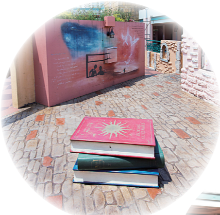
Book Bench ブック型のベンチ 座っている 想像してみよう。