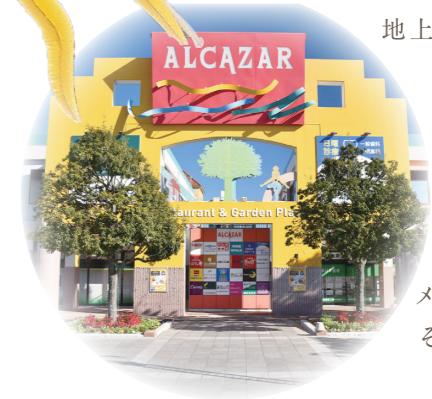
Flower 旅の終わりの花壇 メルヘンチックな旅を終えると、 そこにはかわいらしい花たちが 迎えてくれました。