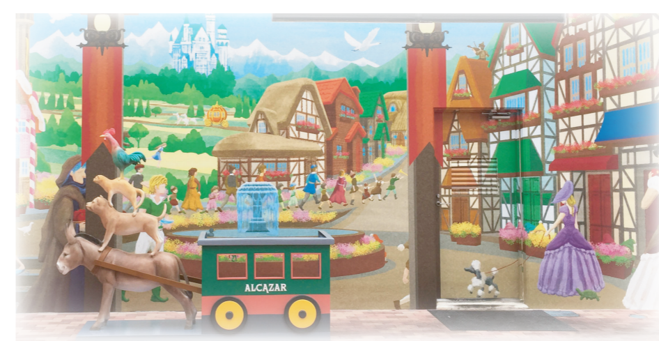
Grimm Fairy Tales グリム童話の世界 グリム童話の様々な主人公たちが、 パノラマで織りなす絵本の世界に誘います。