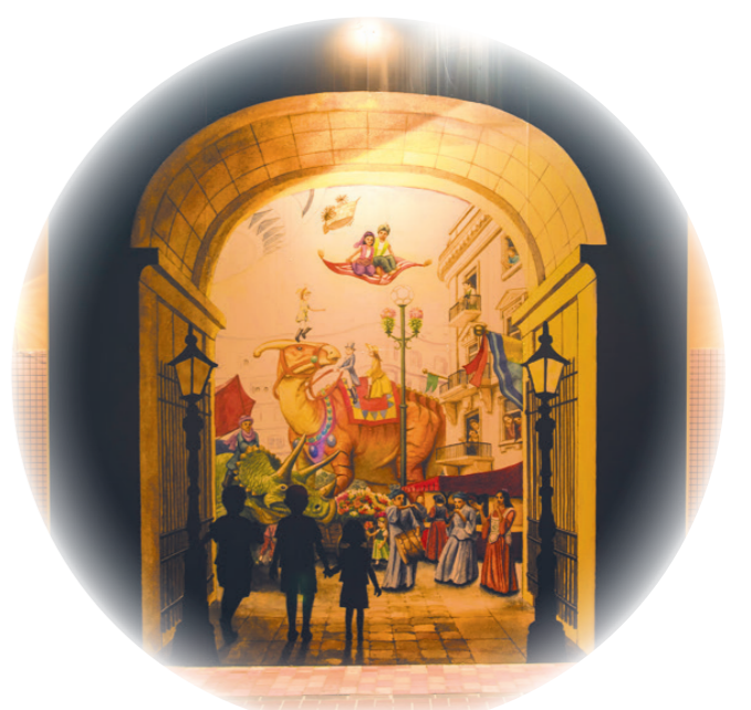
fantasy ゲートの向こうのワンダーランド 子どもたちがのぞくゲートの先は、 恐竜や空飛ぶ絨毯が存在する ワンダーランドでした。