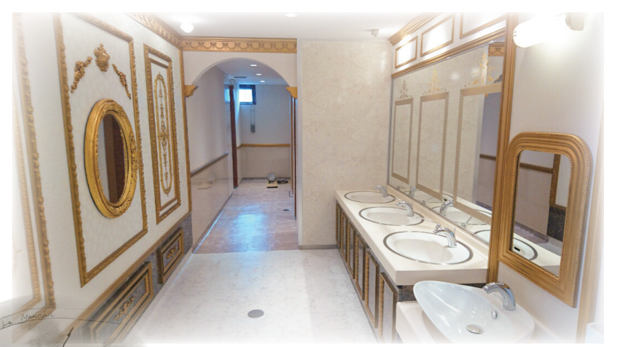
Restroom 中世ヨーロッパ調のレストルーム 男性用レストルームは ドン・キホーテがお出迎え。 女性用レストルームは 王女様の館に入り込んだかのようです。