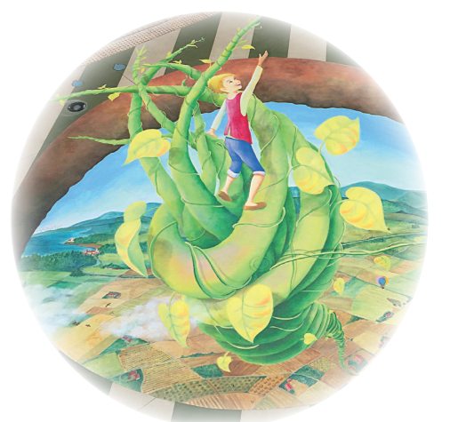
Jack and the Beanstalk ジャックと豆の木トリックアート 天空の城アルカサールでは、 地上から登ってくるジャックに出会えます。