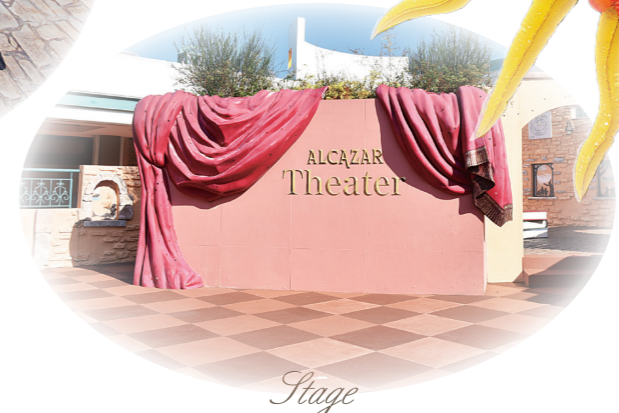
Stage アルカザール・シアター・ステージ ステージでは様々なイベントが 開催されます