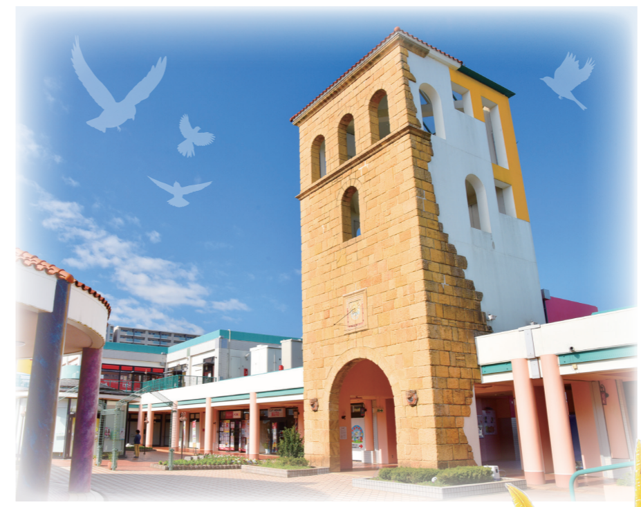
Alcazar Tower シンボルタワー ステキな音色のオルゴールを 鳴らすことができます。